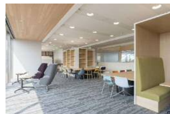
クリエイティブスペース