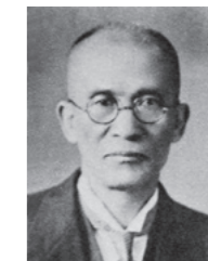
「特殊特微品主義」を提唱した三代目小泉重助