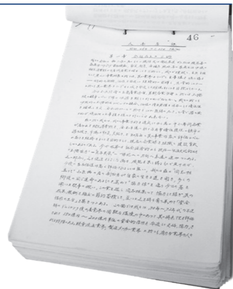
昭和20年代の社員教育資料。当時すでに、マズローの欲求5段階説に言及