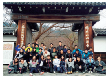
西教寺での新入社員研修